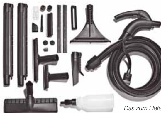
Das zum Lieferumfang gehörende Zubehör deckt alle Anwendungen ab

Es sind nur wenige Schritte für die Inbetriebnahme notwendig. Druckschlauch anschließen, Wasser und evtl. Reinigungsmittel